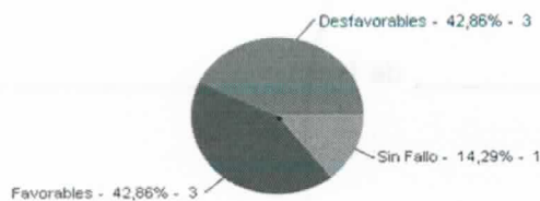
Tasa de éxito procesal en primera instancia 2015 (incluye procesos judiciales y arbitramentos)

Hay 3 procesos con inconsistencias entre la instancia y los fallos reportados que no fueron incluidos en este indicador