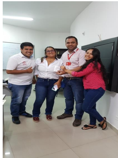
Oficina de Comunicaciones