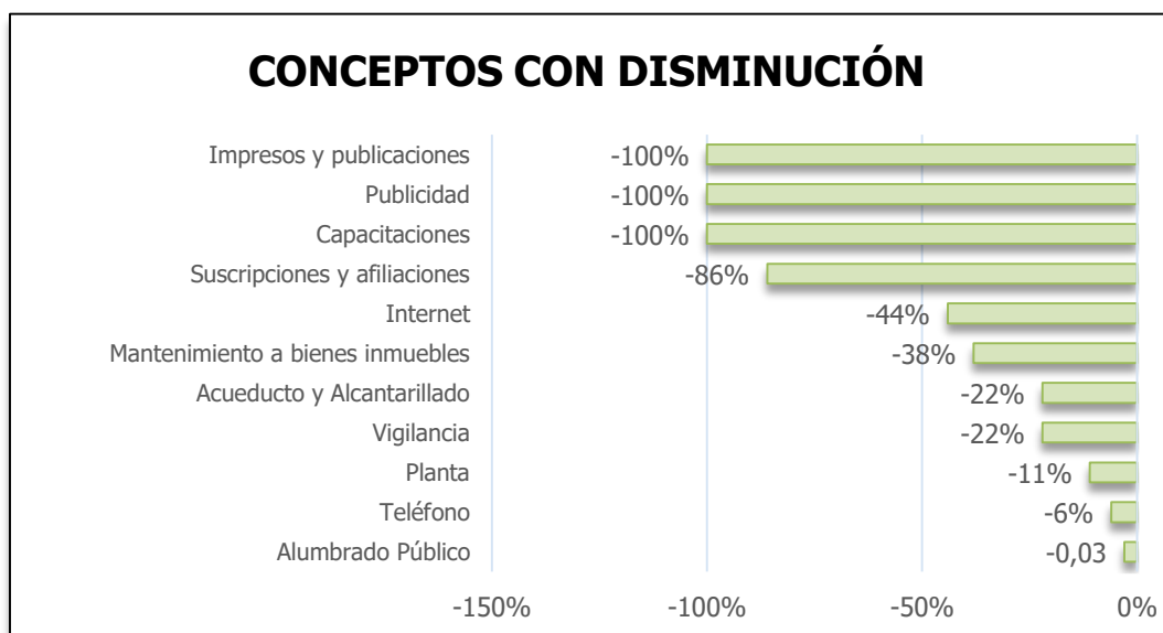
Gráfica 1. CONCEPTOS CON DISMINUCIÓN

La siguiente gráfica, detalla los conceptos que presentaron aumento en el gasto en la vigencia 2026, en comparación con la vigencia 2025: