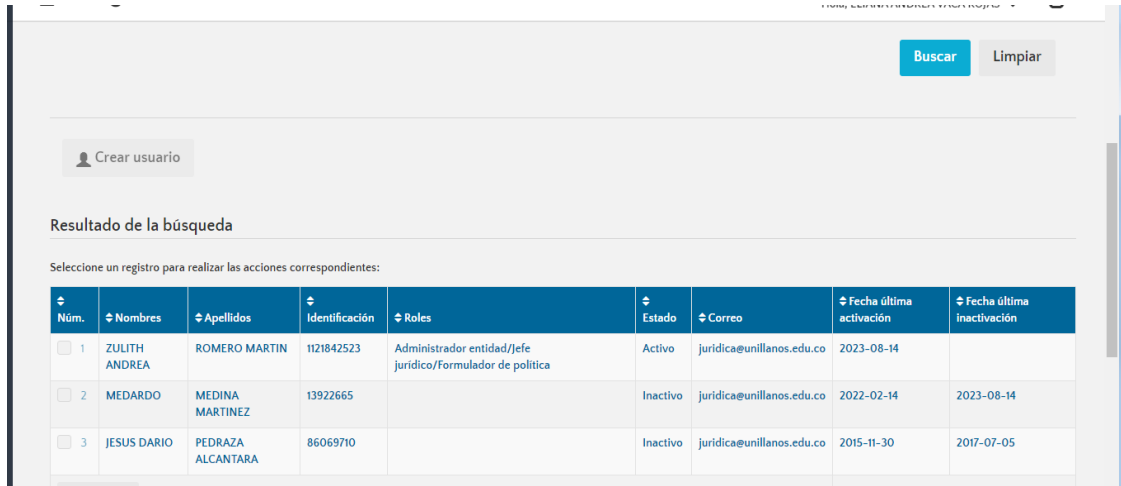
Figura 01 Actualización de usuarios rol jefe jurídico

Se observa que el rol del Jefe Jurídico y administrador se encuentran actualizados.