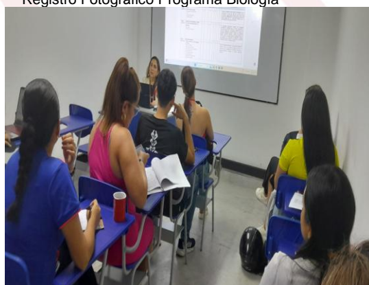
Registro Fotográfico Centro de Idiomas