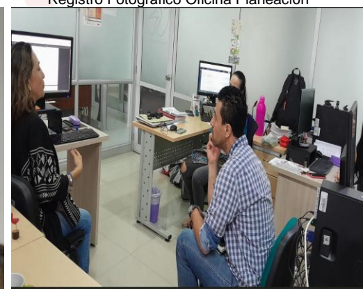
Registro Fotográfico Oficina Contratación