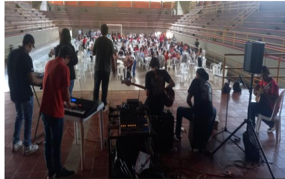
Figura 4 Conmemoración Día del Maestro