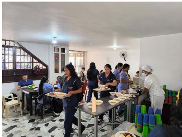
Figura 16 Servicio de restaurantes en campus San Antonio