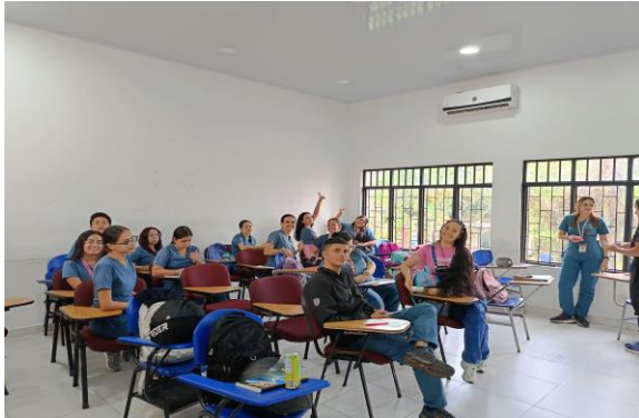
Figura 24 espacio de Consejería Grupal en campus San Antonio