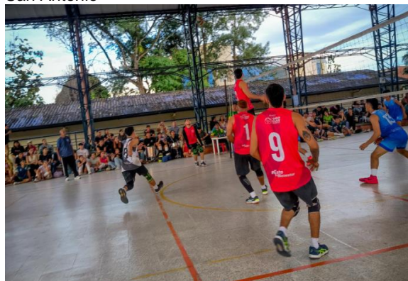
Figura 7 Sesión de práctica de voleibol, en campus San Antonio