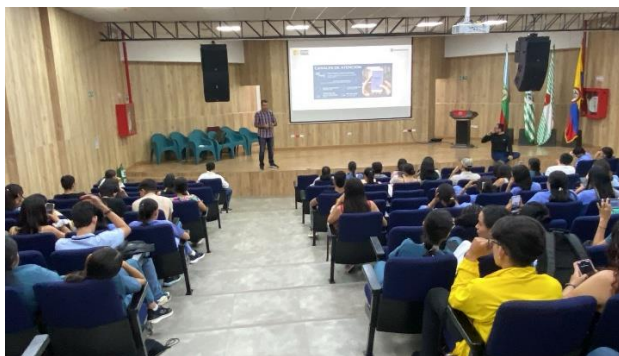
Figura 14 Jornada de oferta de servicios socioeconómicos con apoyo yo DPS y Alcaldía Municipal

El eje tiene como propósito promover las estrategias culturales y las expresiones artísticas que faciliten y motiven a la participación en espacios y eventos que permitan la integración, interacción y manifestación de sus integrantes, a través de la apreciación, valoración y disfrute de las diferentes expresiones artísticas y culturales, en pro de la salud mental, el buen uso del tiempo libre, mejorar la calidad de vida y la convivencia de la comunidad universitaria. Consolidando a la Universidad de los Llanos como espacio en permanente diálogo y goce de la cultura y las expresiones artísticas individuales y colectivas, en donde las diversas identidades, saberes, experiencias y sentires se hacen presentes para expresarse y construir territorio (Acuerdo Superior 011 de 2024).