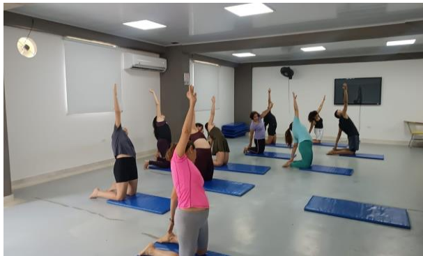
Figura 5 Sesión de yoga salón de espejos campus Barcelona.