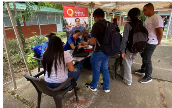
Figura 15 Feria de servicios de Bienestar 2025