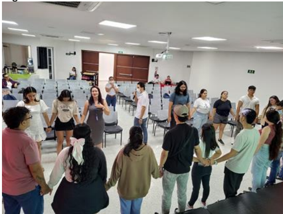
Figura 18 Convención semillero docente