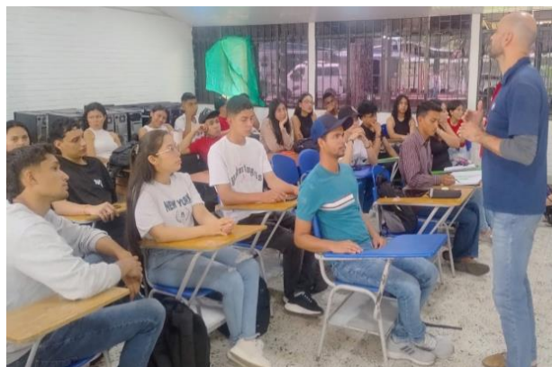
Figura 2 Práctica de la modalidad de Narración Oral.