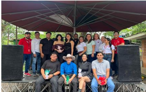
Tabla 4 La Voz Unillanista campus Barcelona