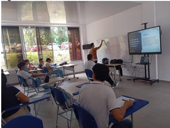
Figura 22 Taller de mentorías