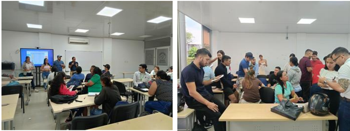
Tabla 2 Consejería Grupal en programa de Ingeniería de Sistemas

La Consejería Grupal es un mecanismo preventivo fundamental para el bienestar y la permanencia estudiantil. Se concreta en talleres que abordan dimensiones clave para el desarrollo integral de los estudiantes de pregrado, incluyendo aspectos individuales como habilidades sociales, motivación, salud mental y prevención de acoso o consumo de sustancias; así como aspectos académicos, tales como orientación vocacional, técnicas de estudio y gestión del tiempo, todo ello para mitigar riesgos psicosociales y académicos.