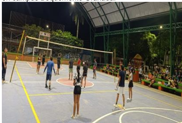
Figura 8 Sesión de voleibol recreativo con estudiantes en campus Boquemonte Granada.

Las disciplinas disponibles fueron Fútbol (para funcionarios, docentes, egresados, femenino y masculino), Fútbol Sala, Voleibol Piso, Baloncesto, Atletismo, Taekwondo, Natación y Fútbol Escuela de Formación Sub-23. Todos los entrenamientos tuvieron horarios y lugares específicos para la comodidad de los participantes