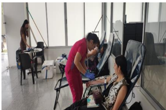
Figura 3 Donación de sangre en campus Boquemonte (sede Granada)

Durante el primer semestre de 2025, el Área de Salud impulsó activamente el autocuidado y estilos de vida saludables en la comunidad universitaria. Se llevaron a cabo diversas actividades, incluyendo jornadas de planificación familiar, donación de sangre, y educación sobre prevención del cáncer de seno y enfermedades de transmisión sexual.