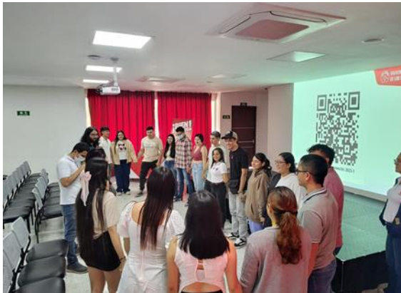
Figura 20 Espacio de trabajo colaborativo