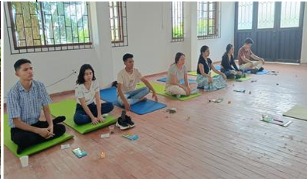
Tabla 5 Campaña de prevención de la Ansiedad en el Campus San Antonio