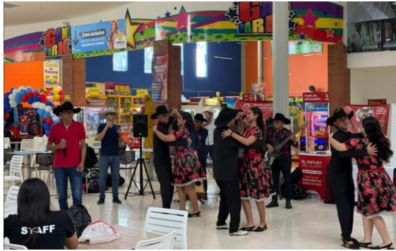
Figura 3 Día de la Llaneridad en centro comercial UNICO