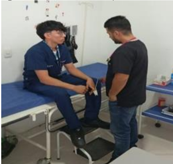
Figura 1 Asesoría médica en campus Barcelona