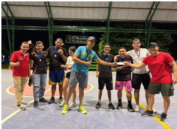
Figura 12 Premiación torneos en campus Boquemonte