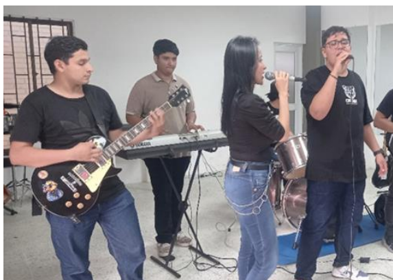
Figura 1 Práctica Artística de la modalidad de Música y Técnica Vocal