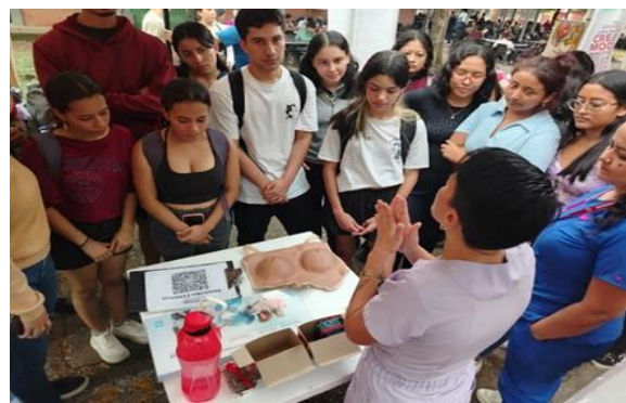
Figura 4 Campaña autoexamen de seno en el campus San Antonio