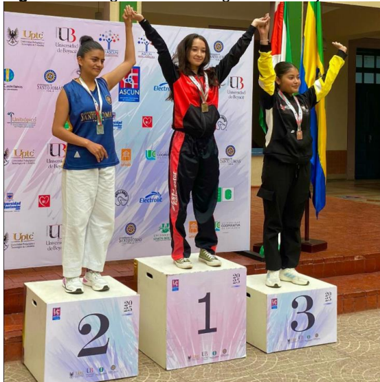
Figura 10 Juego ASCUN Regionales Tunja 2025